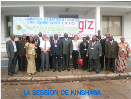
LA SESSION DE KINSHASA

Dans le cadre de ses missions visant l'harmonisation des textes d'application du code de la navigation intérieure CEMAC/RDC, la CICOS a adopté un Règlement Commun relatif du contrat de transport des marchandises par voies d'eau intérieures applicable à tous ses Etats membres.