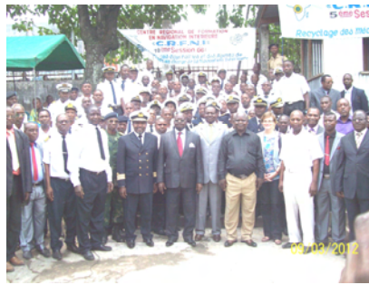
Les stagiaires autour du Ministre et du SG/CICOS

nistration, et de la 5 ème promotion des mécaniciens des bateaux, des barreaux et des matelots. Le Ministre a félicité leurs encadreurs et exhorter la CICOS et ses partenaires à maintenir le cap afin de faire de cette institution de