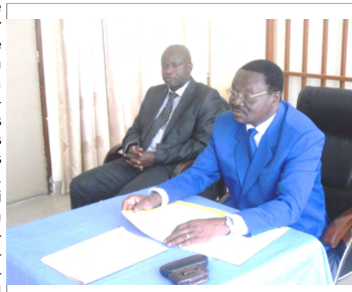
LE SG/CICOS PRONONCANT SON DISCOURS

Pour le personnel dont le porte parole, le Chef de Service Administratif, Financier et Ressources Humaines , avait déjà souligné dans son discours, l'impérieuse nécessité pour chacun de « donner le meilleur de soi-même et de s'éva-