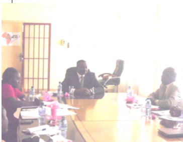
LA SEANCE DE TRAVAIL AVEC L'ACTT-CN