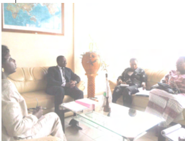
LE SG/CICOS ET SES HOTES DE L'EAA