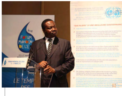
LE SG/CICOS LORS DE SA COMMUNICATION

La gestion par bassin ça marche quand il y a une forte volonté de tous les acteurs. C'est l'un des principaux messages que les organisateurs de cette rencontre planétaire ont voulu faire passer. Au cours de la ses-